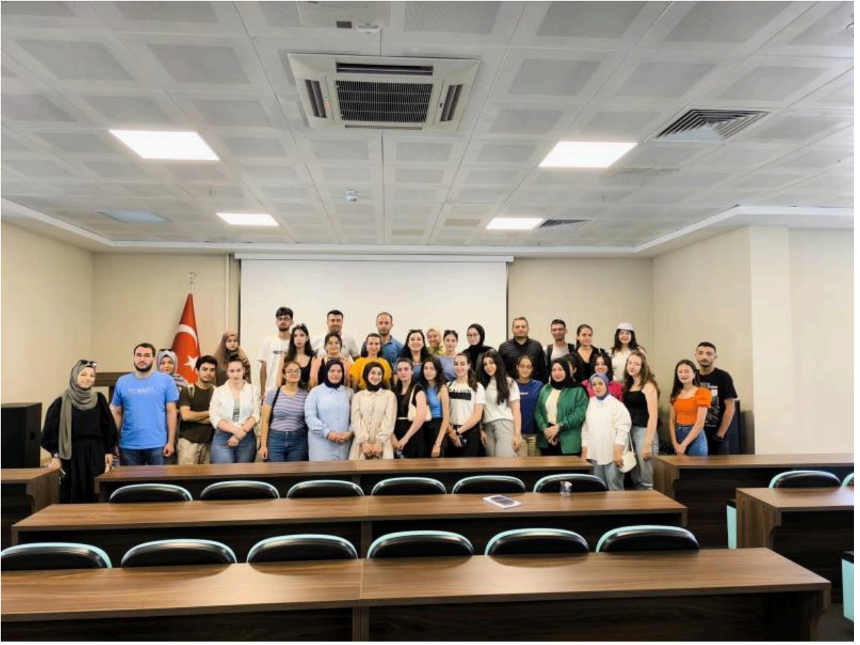
06.06.2024 tarihinde sosyal hizmet bölümü öğrencileriyle Sosyal Yardımlaşma ve Dayanışma Vakfına ziyaret gerçekleştirilmiştir.