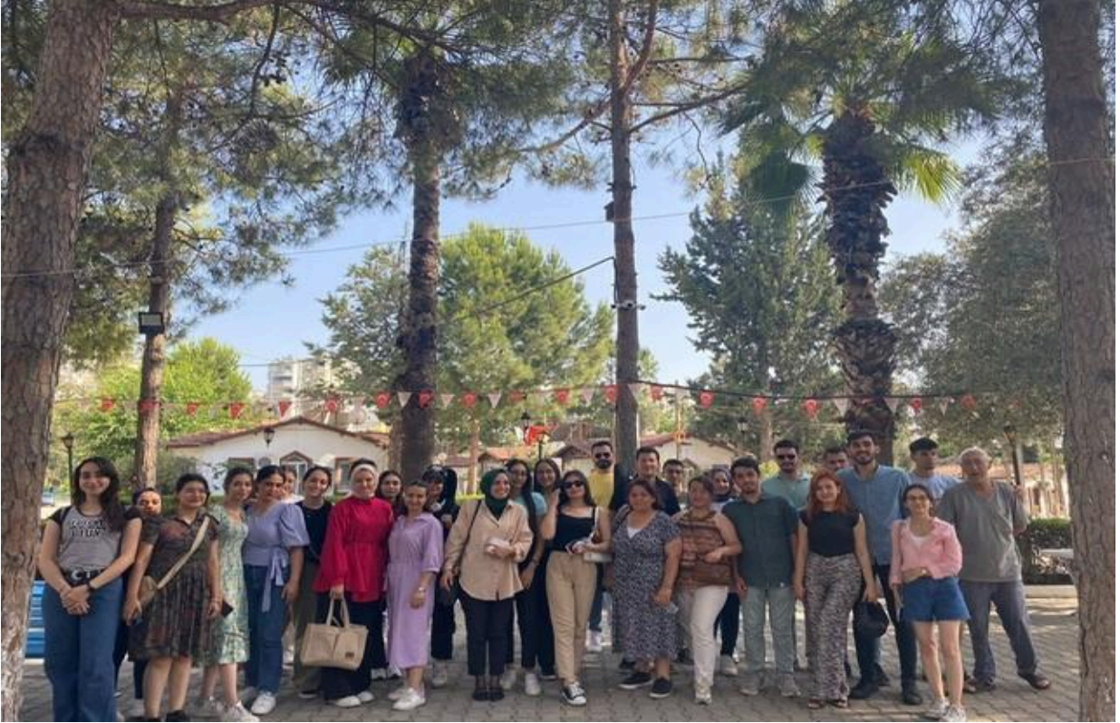
7 Haziran 2024 tarihinde Tarsus Üniversitesi Sosyal Hizmet Öğrenci Topluluğu ve Çukurova Üniversitesi Temiz Türkçe Kulübü olarak birlikte gerçekleştirilen "Huzurevi Buluşması" etkinliği, yaşlı bireylere yapılan içten ziyaretle keyifli bir şekilde tamamlandı. Şarkılar, türküler, oyunlar ve samimi sohbetlerle geçen etkinlikte öğrenciler hem eğlenmiş hem de yaşlılık dönemi hakkında fikir edinmiş oldu.