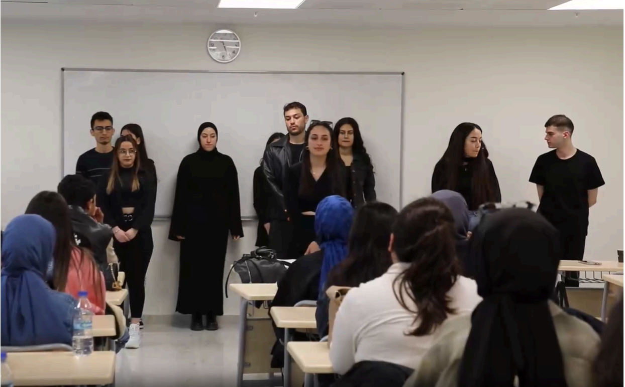
“8 Mart Dünya Kadınlar Günü” nedeniyle bölümümüz öğretim üyeleri ve öğrenciler bir araya gelerek Dünya Kadınlar Günü’nü kutladı. Sosyal Hizmet Bölümü öğrencileri bu yıl kadına yönelik şiddet ve çocuk istismarı konusuna dikkat çekmek için öldürülen ve istismara maruz kalan çocukları canlandırarak kadına ve çocuğa yönelik hak ihlallerini görünür kıldılar.