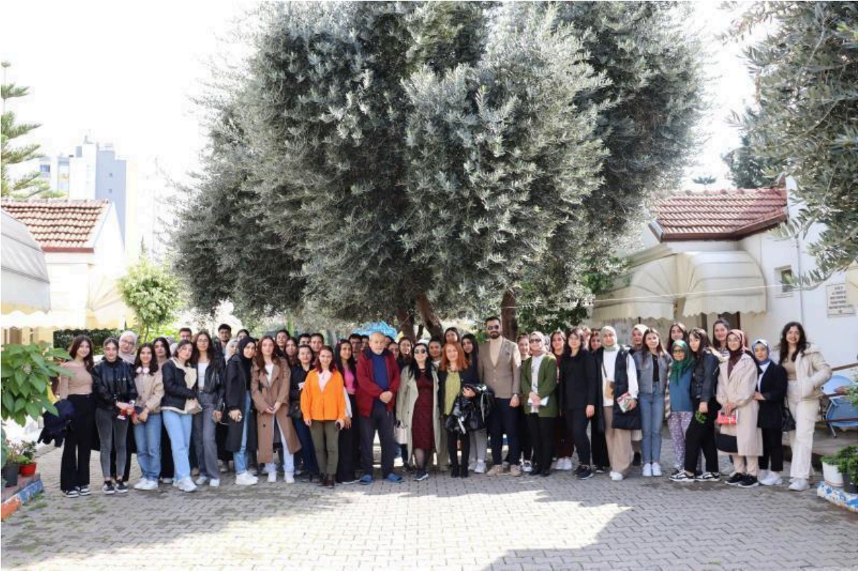
21.03.2024 tarihinde sosyal hizmet bölümü öğrencileriyle Şehit Kara Pilot Yüzbaşı Serhat Sığınak Huzurevi Yaşlı Bakım ve Rehabilitasyon Merkezine ziyaret gerçekleştirilmiştir.